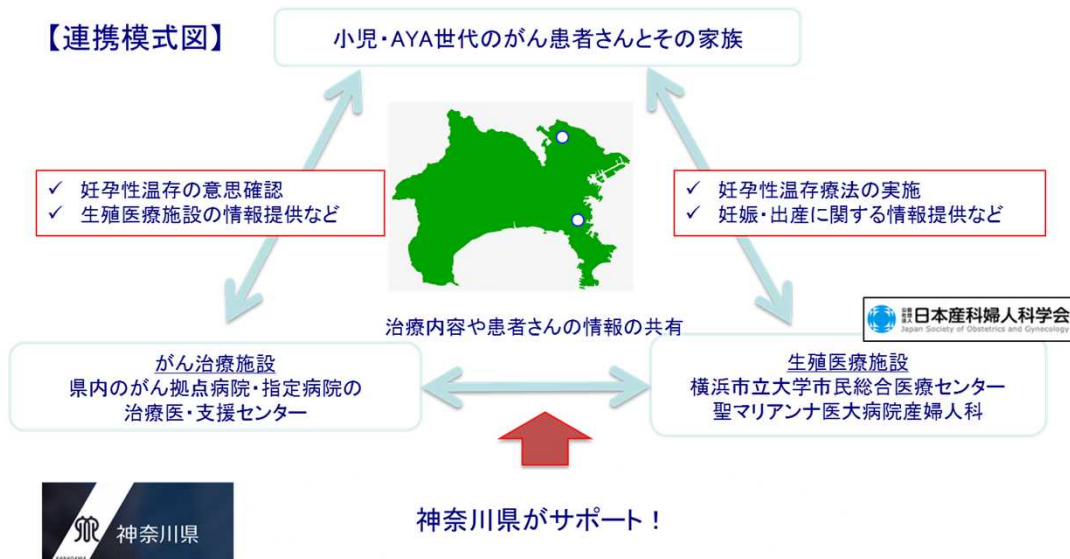
KanaOF-Net(神奈川県がん・生殖医療ネットワーク)