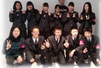
福井県のアピタ敦賀店にて街頭啓発活動。高校生のみなさんにご協力いただきました