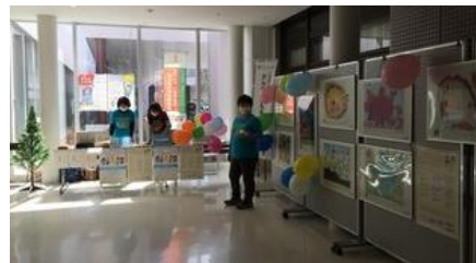
福島医大病院1階で小児がんデーキャンペーンを開催