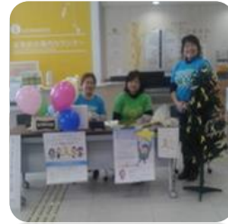
四国こどもとおとなの医療センターでの啓発活動