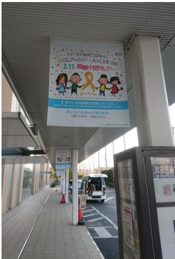
東京都立小児総合医療センター前のバス停にバナーを付けていただきました