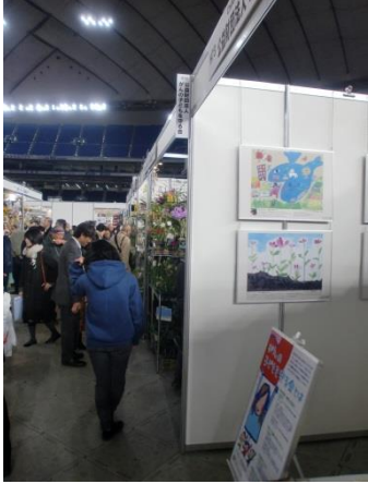
今年で3回目となりましたが、12万人が来場した「世界らん展2018」にブース出展(東京ドーム)

公共施設や病院、ショッピングモールの一角を使って、小児がんの子どもたちが描いた絵画のパネルや小児がんの資料展示、イベントを行いました。一般の方が多く立ち寄る場所での常設展示は、小児がんの認知度向上に一役買ってくれたことと思います。