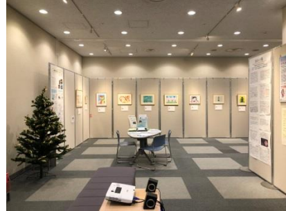
東京都文京区のシブickセンターで絵画展開催