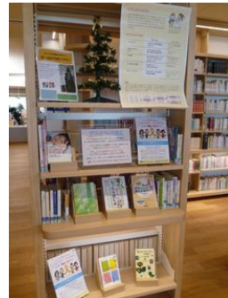
神奈川県大和市立図書館での小児がん図書特集展示