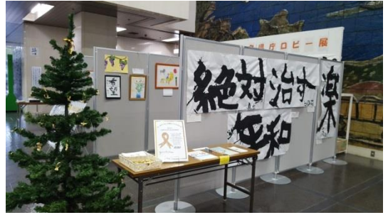
福岡県庁でのロビー展