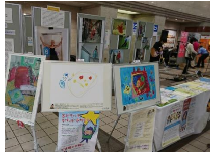
横浜駅東口地下そごう前で「みんなで知ろう小児がんのこと」(主催:神奈川県立子ども医療センター小児がんセンター)