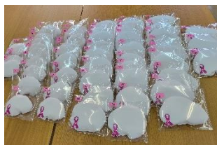
横に延びるのが特徴で、 脇への補正もしやすい