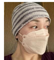
抗がん剤治療時はつばを取り外すことができる。