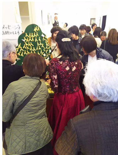
あんさんぶる七のおとNana-note チャリティーConcert(広島)