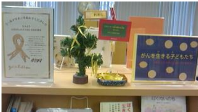
岡山中央図書館での展示