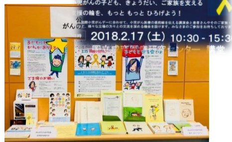
小児がん交流フェスタ2018