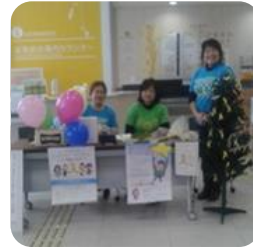
四国こどもとおとなの医療センターでの啓発活動