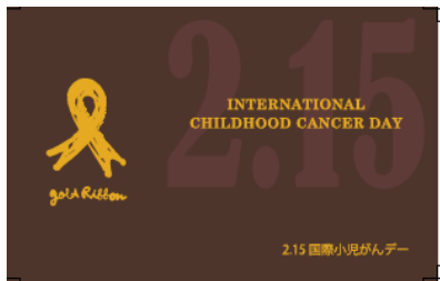
チャリティチョコレートに添えた啓発カード