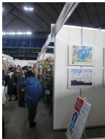
今年で3回目となりましたが、12万人が来場した「世界らん展2018」にブース出展(東京ドーム)

公共施設や病院、ショッピングモールの一角を使って、小児がんの子どもたちが描いた絵画のパネルや小児がんの資料展示、イベントを行いました。一般の方が多く立ち寄る場所での常設展示は、小児がんの認知度向上に一役買ってくれたことと思います。