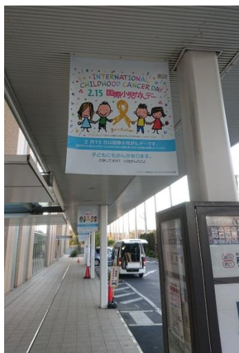
東京都立小児総合医療センター前のバス停にバナーを付けていただきました