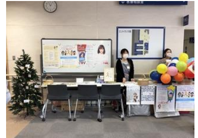
新潟大学病院での啓発活動