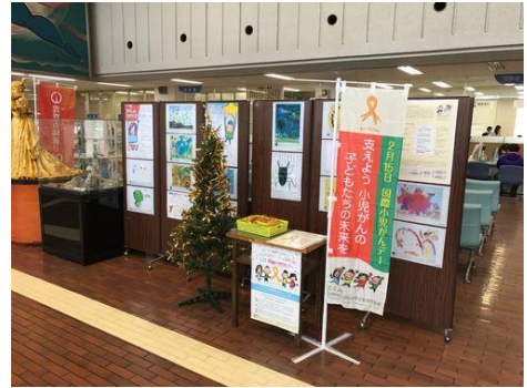
敦賀市役所1階市民ホール