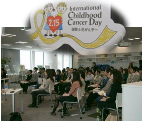
ノバルティスファーマ(株)さまでの啓発講演会