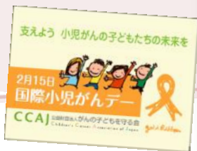
啓発ポケットティッシュ