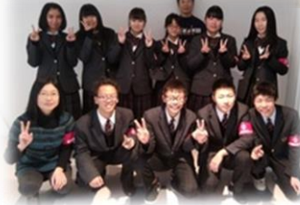
福井県のアピタ敦賀店にて街頭啓発活動。高校生のみなさんにご協力いただきました