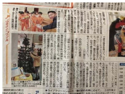
日刊県民福井(2月3日)