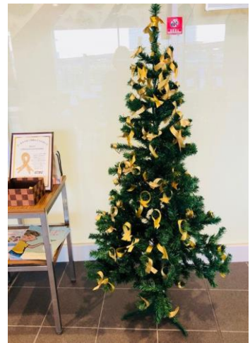
埼玉県立小児医療センター