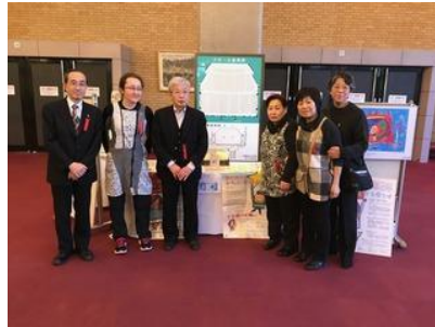
神戸フィルハーモニック ニューイヤーコンサートでの募金・啓発活動