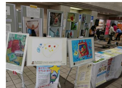
神奈川県大和市立図書館での小児がん図書特集展示