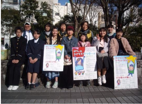
高知支部での啓発活動。たくさんの方にご協力いただきました。

また、各地で、小児がんについて考えるシンポジウム、講演会なども開催し、小児がんの現状や当会の活動を紹介し、患児・家族の抱える問題などに触れ小児がんへの理解を呼びかけました。