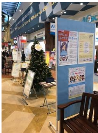
アフラックマリナタウン店(九州)