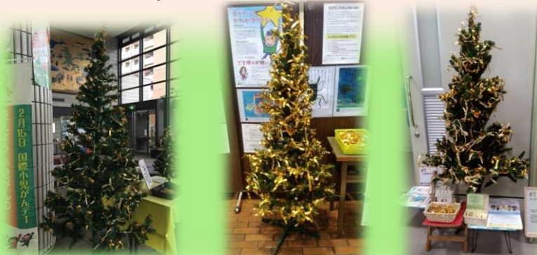
福井県嶺南地区: 小浜市役所／敦賀市役所／敦賀病院 ／小浜市本馬医院