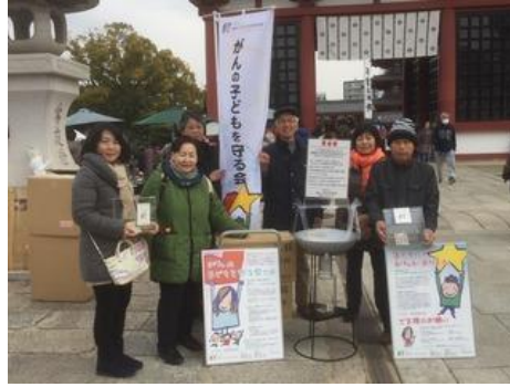
大阪の四天王寺さまのご協力により境内で募金・啓発活動