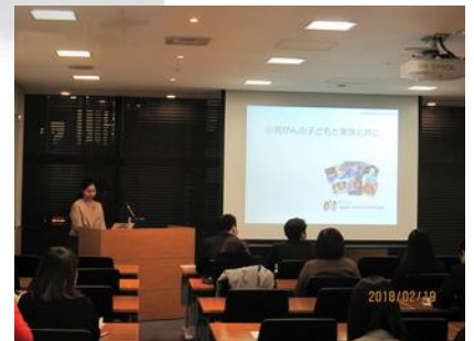
明治安田生命保険相互会社さまでの啓発講演会