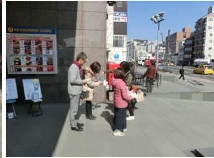
長崎ゆめタウン夢彩都前での募金・啓発活動