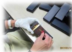
ボランティアさんたちの手で一つ一つ丁寧にパッケージ