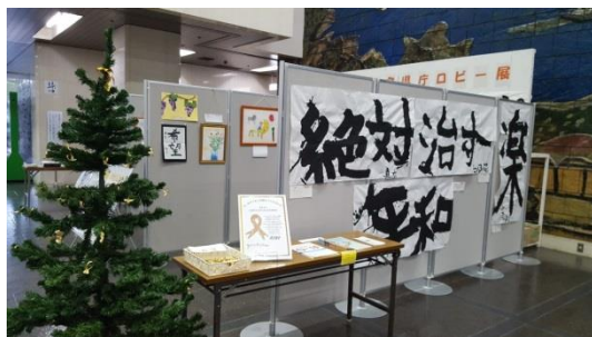
横浜駅東口地下そごう前で「みんなで知ろう小児がんのこと」(主催:神奈川県立子ども医療センター小児がんセンター)