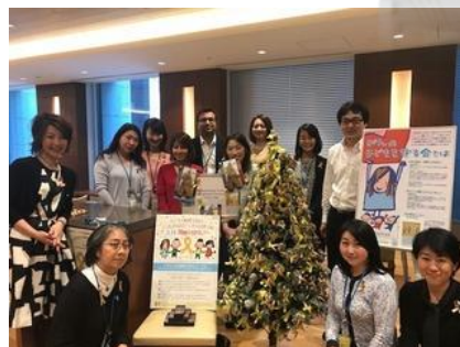
モルガンスタンレーさまのご協力による啓発活動(スターボックスにて)