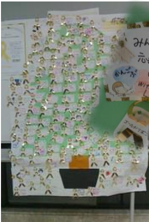
岡山大学病院。温かいメッセージもいただきました

ゴールドリボンツリー(小児がんのシンボルである「ゴールドリボン」で装飾したツリー)が地域でも広がり、ツリーが賑やかに装飾されたり、応援メッセージがたくさん寄せられたりするなどの反響がありました。