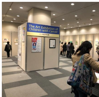
東京都文京区のシビックセンターで絵画展開催