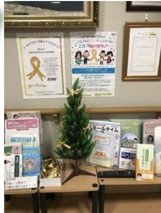
鹿児島県の会員さんのご尽力で県内15か所に設置することができました