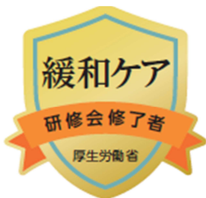
研修会修了者バッジ