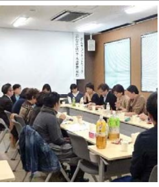
がんサロン ネットワーク連絡会 開催

2月14日（土）、琉球大学大学院セミナー室にて、がん診療連携拠点病院・がん患者会・ピアサポーターが連携し、互いの活動をがん患者さんやそのご家族等の支援に還元することを目的に、がんサロンネットワーク連絡会が開催されました。県内では今回初めての試みで、県内8団体の患者サロンから17名の世話人・医療従事者が参加。県内のがん患者サロンの世話人や患者サロン担当の医療従事者が一堂に会し、互いの活動内容の情報交換と交流を深め、患者サロンの活動や連携方法について活発に意見交換がされました。