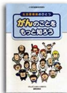
小学校健康教育教材資料