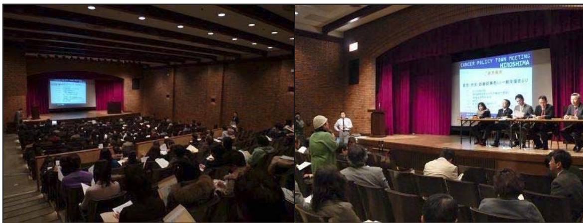
タウンミーティングの様子

当日、各参加者が記入した意見提出シート内容及び会場内での提言内容については、提案書とりまとめワーキンググループ(WG)において集約を行い、3月上旬に開催予定の国のがん対策推進協議会において提案書としてまとめられたのち、厚生労働大臣に提出される予定です。