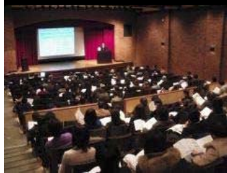
がん対策に関するタウンミーティング (広島県、2010年1月17日開催)