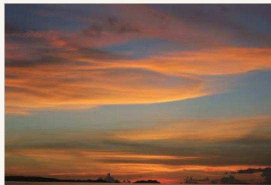
あかたすんどらち 赤田首里殿内 くがにどらる 黄金灯籠下ぎてい あ うりが明かがりば みるくうんけー 弥勒御迎