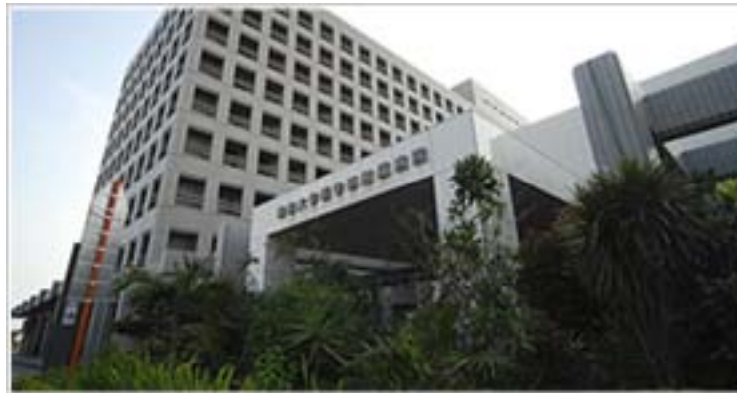
沖縄県がん診療連携拠点病院 (琉球大学医学部附属病院)